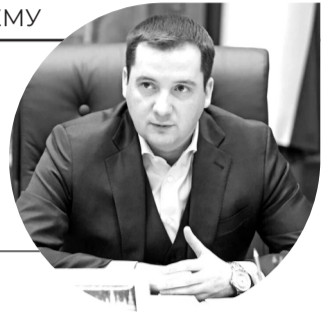
Александр Цыбульский, губернатор Архангельской области

– По итогам 9 месяцев 2023 года в Архангельской области количество посещений учреждений культуры по Пушкинской карте увеличилось в два раза по сравнению с прошлым годом. 79 тысяч билетов на сумму порядка 32 млн рублей использовала наша молодежь в этом году.