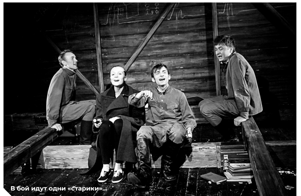
В бой идут одни «старрики»...

«Мое потрясение, и я не боюсь этого слова, заключается в том, что я увидела то, чего я совсем не ожидала. Это очень простой спектакль, лишенный какого бы то ни было пафоса. Даже намек на пафос там нет. Четыре молодых актера заме-