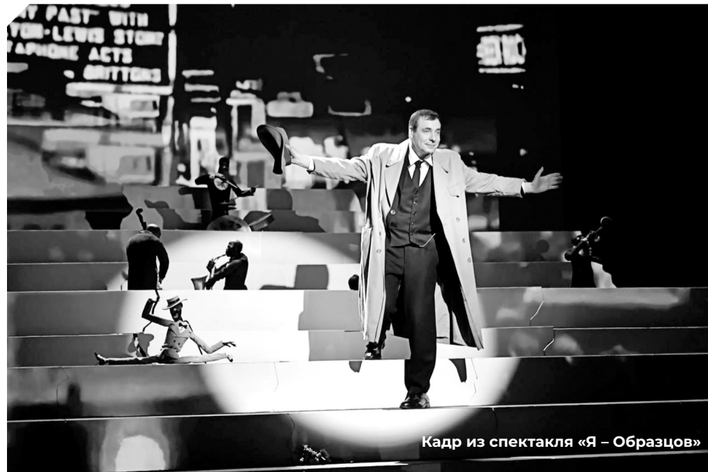
Кадр из спектакля «Я – Образцов»

Информация о спектаклях, дата и время показов – на сайте Архдрамы. Билеты в кассе театра и на официальном сайте https://arhdrama.culture29.ru/