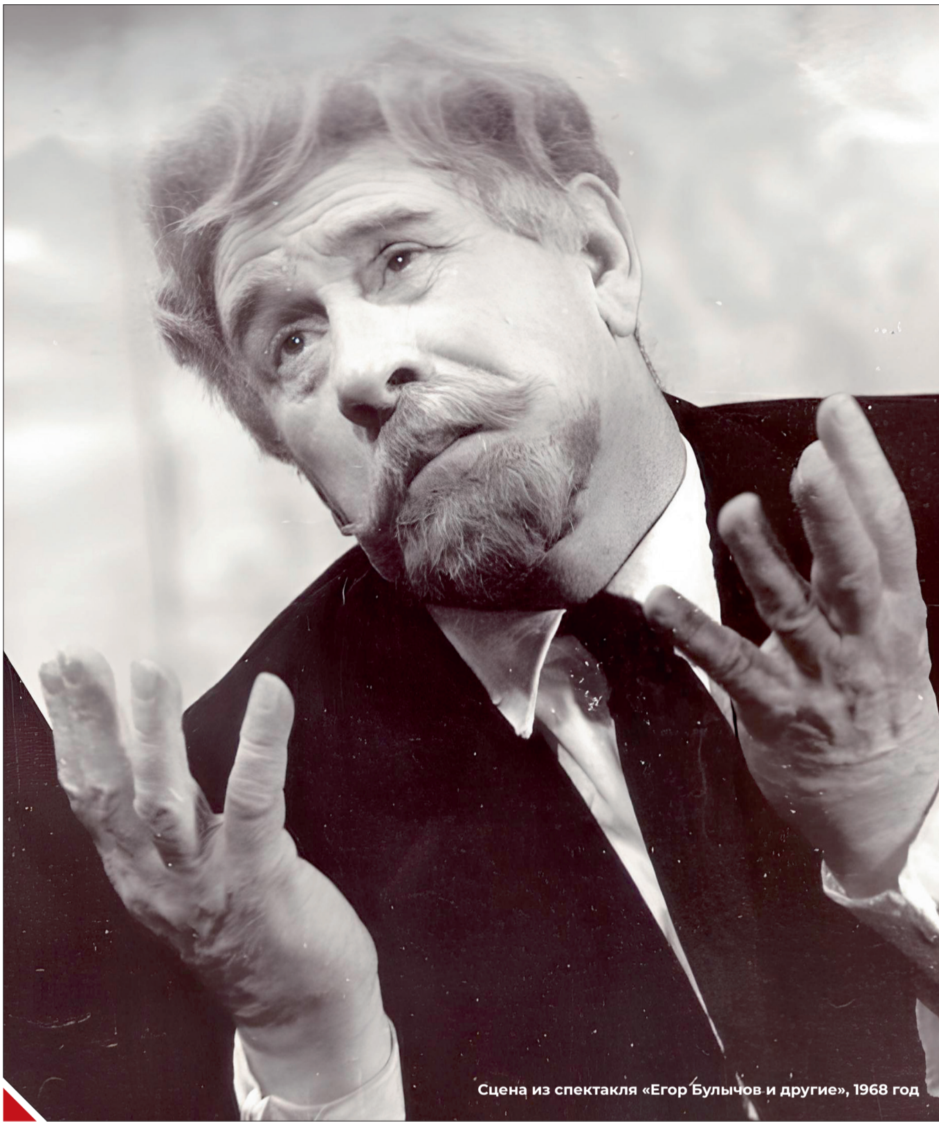
Сцена из спектакля «Егор Булычев и другие», 1968 год