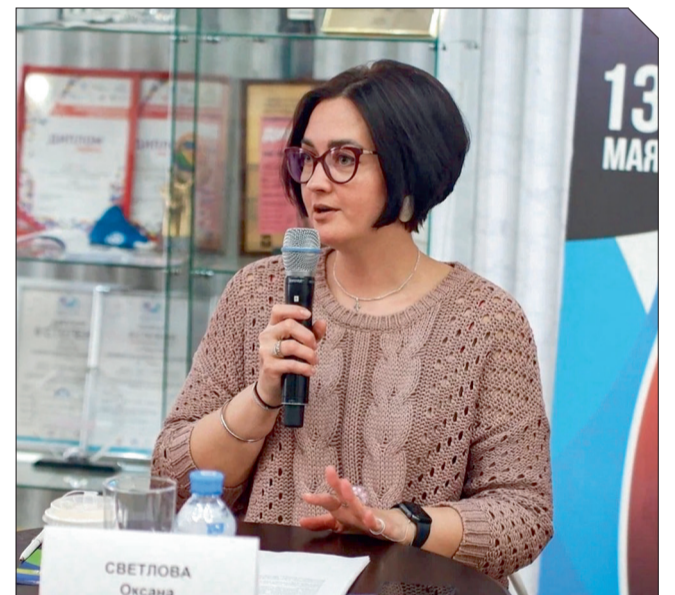
ОКСАНА СВЕТЛОВА, МИНИСТР КУЛЬТУРЫ АРХАНГЕЛЬСКОЙ ОБЛАСТИ

– Символично, что международный фестиваль «Ломоносов Фест. Искусство. Наука. Технологии» проходит на площадке Архангельского театра драмы и в партнерстве с Северным (Арктическим) федеральным университетом, которые названы в честь нашего знаменитого земляка М.В. Ломоносова, внесшего неоценимый вклад в науку и культуру нашей страны.